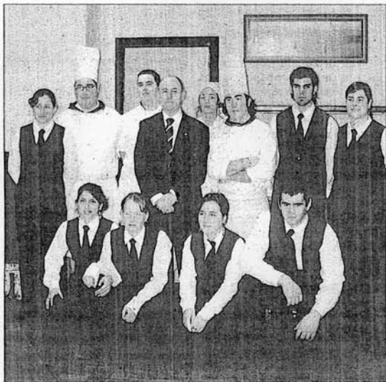
►► Alumnos de Hostelería con un profesor, ayer.